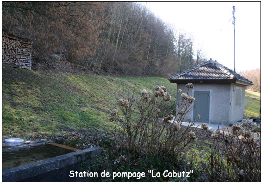
Station de pompage "La Cabutz"