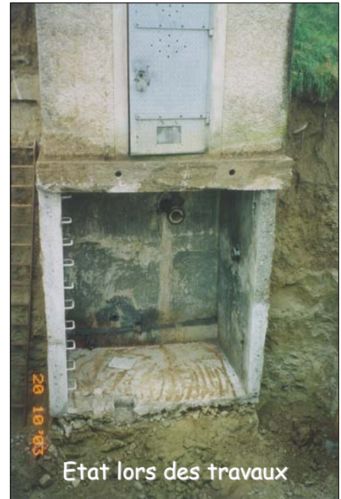
Etat lors des travaux

L'ensemble de la tuyauterie a été choisi en acier inoxydable pour des raisons d'hygiène et de durée de vie. La réserve incendie est bloquée par une vanne papillon automatique, télécommandée depuis le local des pompiers ou le poste de commande.